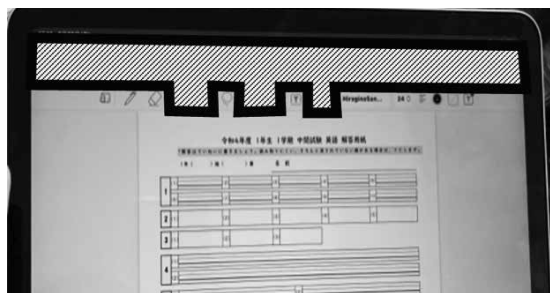
Fig. 3 解答用紙閲覧用 iPad 作業領域制限

定とすることで見た目の縦書き化は可能だが、「チョコレート」では「一」が縦書きとならず横線のままとなることに類する不具合がある。試験中は、可能な限りテキストボックスや文字間隔を工夫することで解答枠内に収まる記述を期待するが、マスを印字した記述解答欄は横書きで解答することを教科担当教員との打ち合わせで確認した。